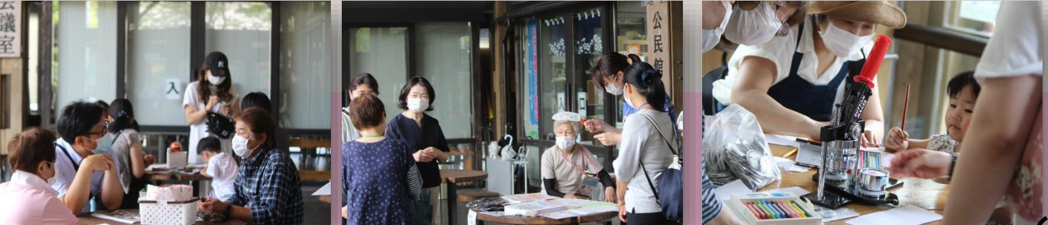
お絵かきして缶バッジづくり♪