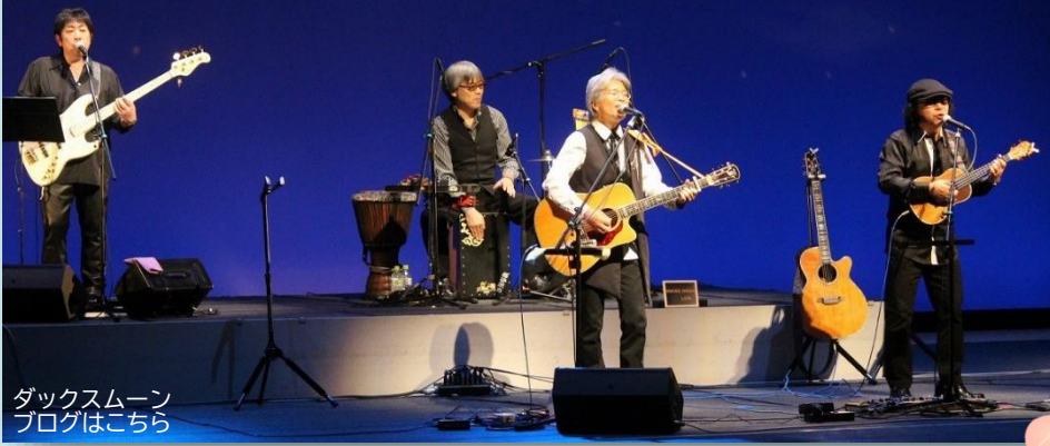
ダックスムーン ブログはこちら

2019年9月22日開催の岩出山5地区公民館合同事業「未来へ歌を歌おうコンサート」