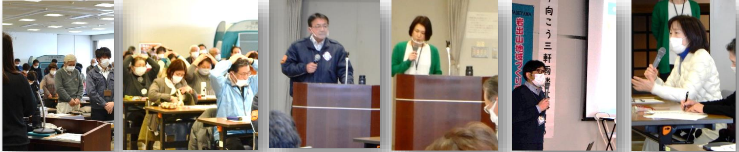
①黙祷 → ②避難確認 → ③会長挨拶 → ④講座ふり返り → ⑤大崎市の事例 → ⑥ → ⑦質疑応答 (上写真)