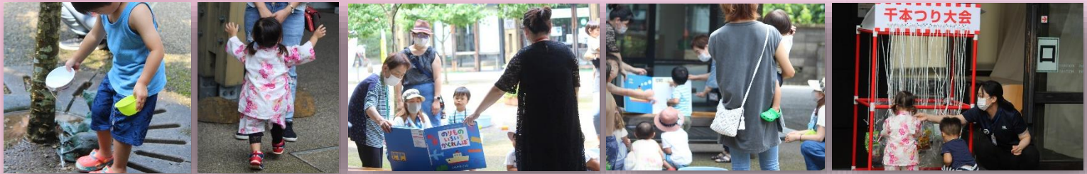
福祉会の方とじゃんけんぽん♪