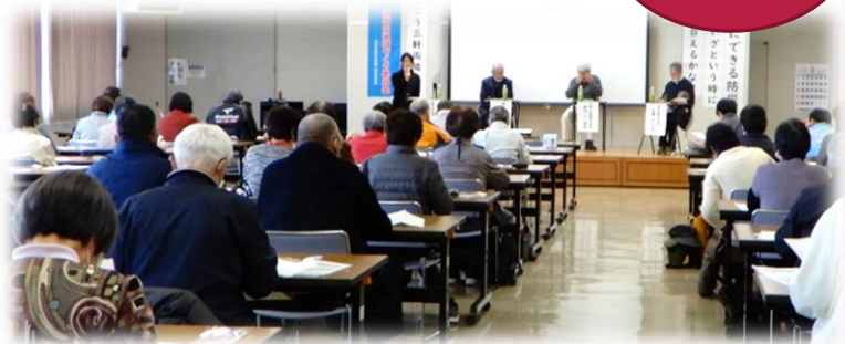
⑥メイン（パネルディスカッション）

日頃の活動を発表された3名の親交会長様、参加された皆様、本当にありがとうございました。ぜひ、継続して「お互いの活動を共有し、学習し合う機会」そして「対話」を、これからも大切にしていきたいですね♪