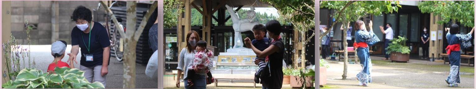
自動しゃぼん玉機大活躍♪み～んな大喜び！お外で、思いっきり遊べました～。